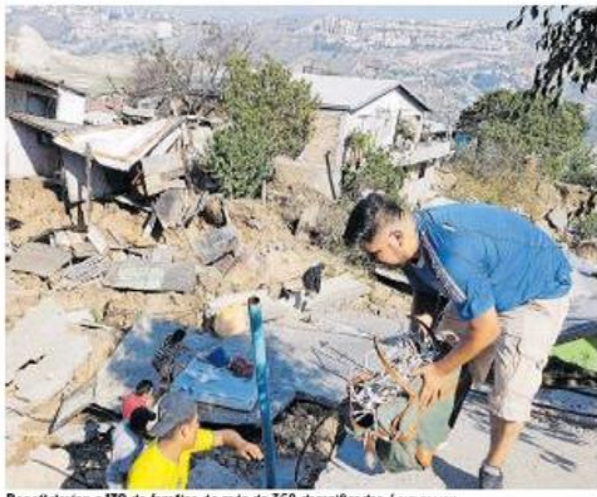
Beneficiarán a 130 de familias de más de 360 damnificadas